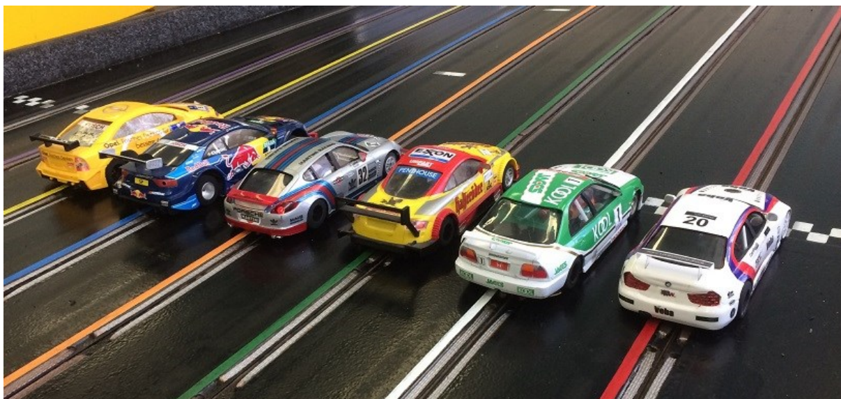
Pohled ze zadu si všichni účastníci pravidelně dopřávali především na bílý vůz BMW M3.

Tradice samozřejmě pokračuje a my se už těšíme na 14. ročník!