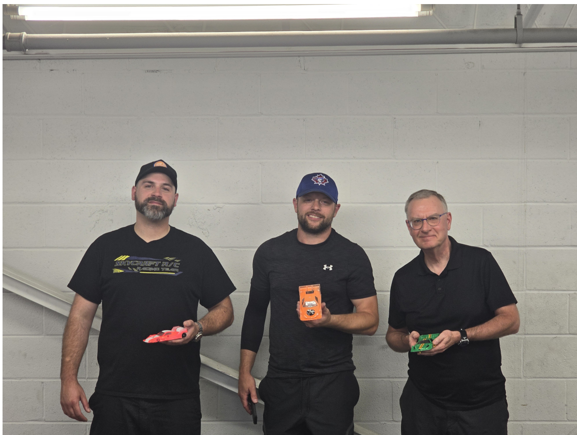
Tabulka 1: Podium BLDTM

První závod BLDTM jsem bral jako trénink. První věc co mě nemile překvapila, že tady nemají warm up, takže je potřeba ihned skočit do závodního tempa. Nejdříve jsem si zvykal na dráhu v závodním režimu a auto s motorem 4500KV nejede zase tolik, proto pro rychlé kolo je potřeba daleko větší přesnost a méně brždění. Nejvíce bych to přirovnal k takovému lepšímu falconu.