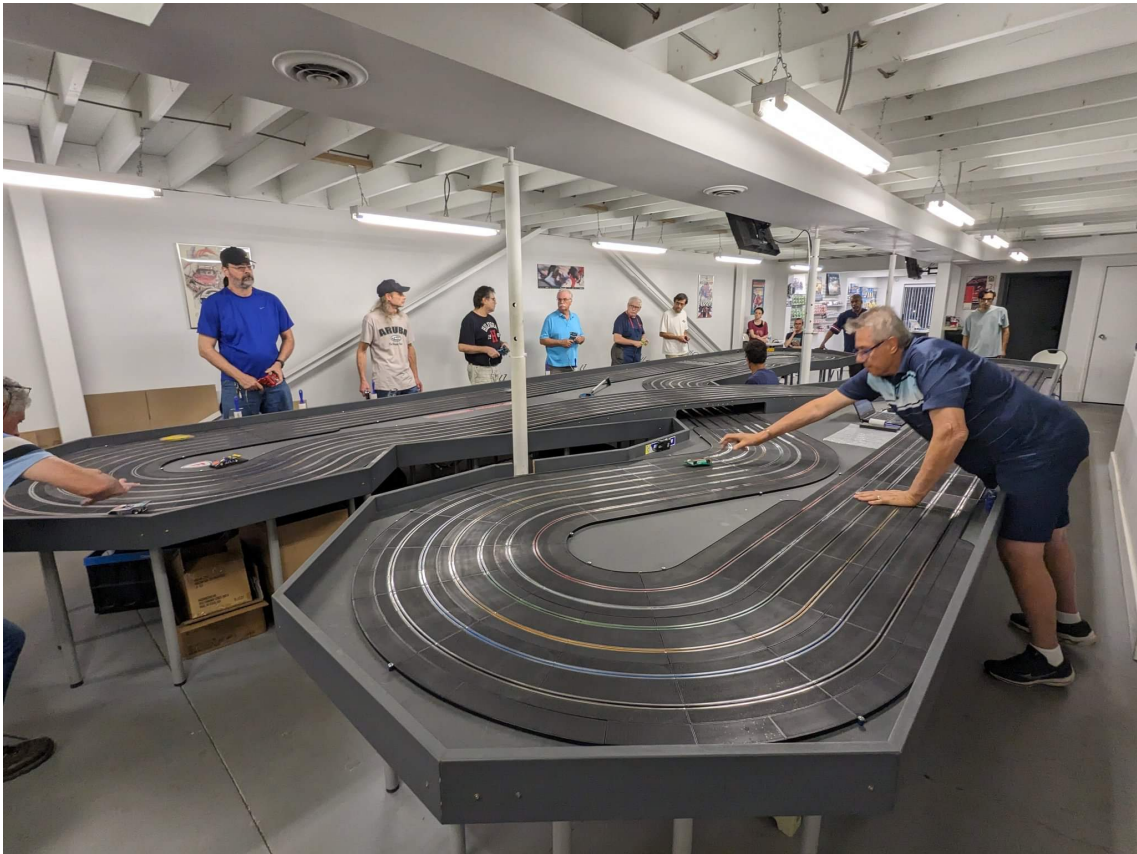
Obrázek 1: